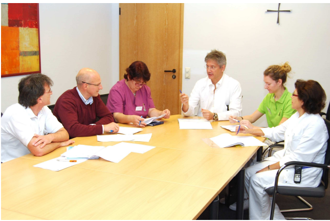
Interdisziplinäre Teamarbeit ermöglicht eine individualisierte Behandlung